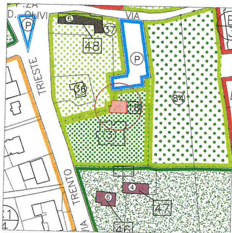
COMUNE DI BREDA DI PIAVE Zona "Sa" SCALA 1:2000