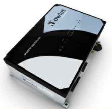
FOTO CENTRALINA TELECONTROLLO SE.CO.