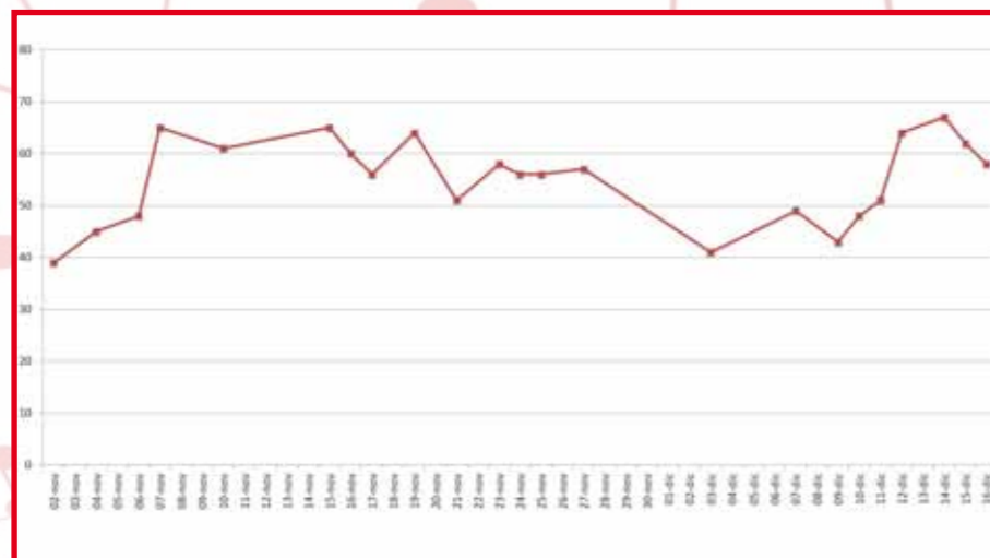
Curva del contagio a Breda di Piave

Durante quest'anno di pandemia, il Comune di Breda di Piave ha messo in campo una serie di iniziative su tutti i fronti per supportare la popolazione bredese.